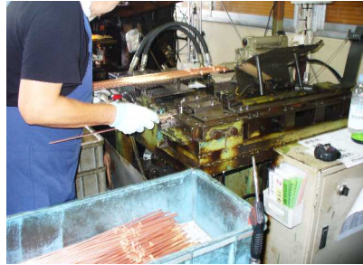
22310-JA10A/6KA0C カシメと穴あけ工程 注意点 類似品

新規受注 M's 他外製からの移管品 ブレージング(事)の依頼 により、7月13日に移管、 15日(月)から生産を開始 しました。