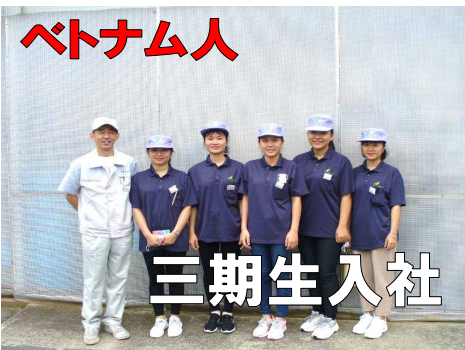
ベトナム人 三期生入社 ベトナム人実習生 三期生5名 2019. 7. 10入社 翌、11日から実務実習に入りました。