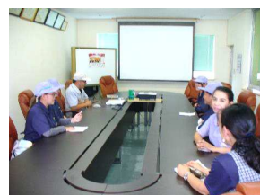
7.10 新人教育を実施 現場での生産活動以外の 社のルールを教育 7名が受講