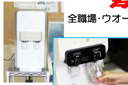
全職場・ウォーターサーバー設置 事務所、一課、二課、三課、Fe 課、生技課の6ヶ所に設置

梅雨明け、暑さの厳しい季節が 到来し、梅雨明けの爽やかな 気候が、夏の始まりを告げ ています。梅雨明けの爽やかな 気候が、夏の始まりを告げ ています。