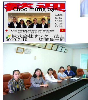
二期生・五期生 歓迎迎会 二期生、五期生の歓迎会が行われ、7月13日、古河市某所にて卒業生と二期生、五期生が交流した。