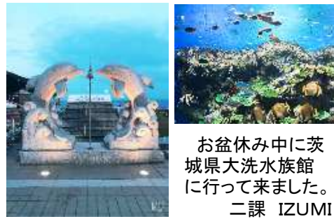
お盆休みに茨城県大洗水族館に行ってきました。二課 IZUMI